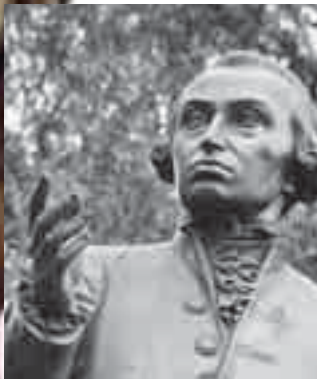
Immanuel Kant.

Hoewel filosofie geldt als een belangrijk onderdeel van onze algemene vorming, zijn daarvan in ons onderwijs heel weinig sporen terug te vinden. 'De filosofische vragen die kinderen zich op jonge leeftijd spontaan stellen, worden nu op school vakkundig afgeleerd.'